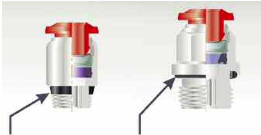
Anello di tenuta per filetti conici.